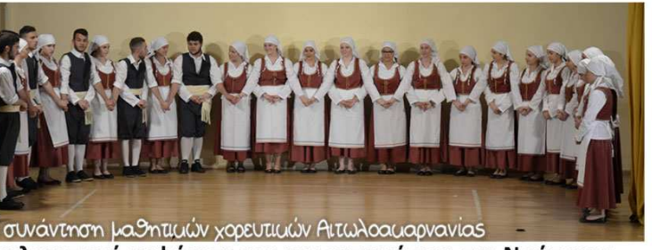
14η συνάντηση μαθητιών χορευτιών Αιτωλοακαρνανίας

σμούς και άγχος για το μέλλον που πολλές φορές είναι δικαιολογημένο και άλλοτε ενσχύεται από την αγωνία των γύρω του, γονιών, καθηγητών, συμμαθητών κτλ. Κατά τη διάρκεια αυτής της περιόδου συνήθως οι έφηβοι ασχολούνται με πολλά πράγματα και βρίσκονται διαρκώς κάτω από την πίεση της αξιολόγησης καθώς συμμετέχουν διαρκώς σε τεστ, διαγωνίσματα, εξετάσεις ξένων γλωσσών, αθλητικούς αγώνες και άλλες παρόμοιες ενέργειες και δραστηριότητες που απαιτούν υψηλές επιδόσεις. Αυτό το κунήνι των επιδόσεων και των υψηλών βαθμών έρχεται στο αποκορύφωμά του στις τελικές εξετάσεις στο τέλος του λυκείου.