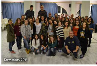
Korn pitas 2016

Τις καλύτερες εντυπώσεις άφησε η γιορτή για την κοπή της πίτας της Χορευτικής Ομάδας του σχολείου μας, που πραγματοποιήθηκε στις 16 Ιανουαρίου και ώρα 6 το απόγευμα στην αίθουσα εκδηλώσεων του Δημορχείου Ολιναδών στο Νεοχώρι. Καθηγητές και μαθητές, συμμετείχαν στη γιορτή που περιελάμβανε πολύ χορό αλλά και πλούσιο γεύμα με φαγητά και αναψυκτικά που έφεραν τα μέλη.