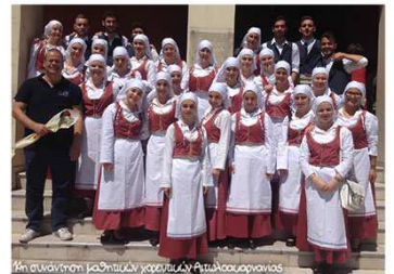
14η συνάντηση μαθητιών χορευτιών Αιτωλοακαρνανίας